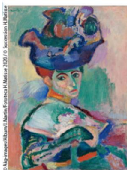
Voilà un tableau de H. Matisse : La Femme au chapeau.

A ton avis, lequel de ces tableaux appartient au fauvisme ?